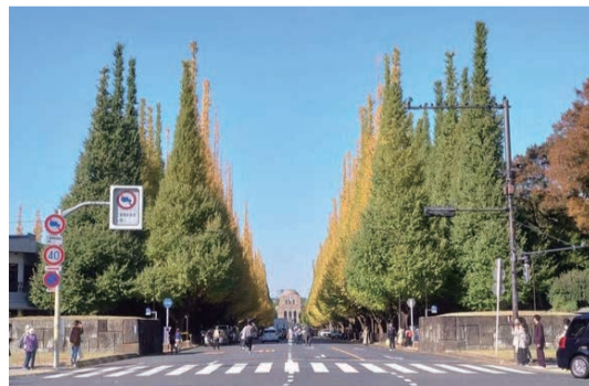
このままでは、左側のイチョウ並木の真裏に球場が建ってしまう。

いま、わたしたちはこの暴力的な再開発の大幅な変更を要求し、神宮外苑の景観と、歴史的遺産でもある 美しいイチョウ並木 を守らなくてはなりません。