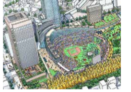
ビル風にさらされる球場で、野球を楽しむことができるのだろうか。

新 設される神宮球場は超高層ビルに囲まれた立地。日の当たらない球場には強いビル風が吹きつける。外野スタンドの一部は削られる。6大学野球の聖地として愛され、緑に囲まれ、青空の抜ける神宮球場は完成度の低い計画に侵されようとしている。