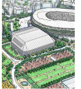
2019年に国立競技場が新設されたのに、なぜ新たなラグビー場が必要なのか。

新 ラグビー場建設予定地は建国記念の森。森の3分の2の敷地を要する計画のため、樹々の伐採と建設により森は全滅するといわれている。再開発はスポーツ施設の間にいくつもの同じような用途の高層ビルを無理やり詰め込んだ計画。現在のラグビー場は耐震補修・改修工事で十分使用できると多くの専門家が提言している。なぜ歴史ある森を破壊して新設しなくてはならないのか。