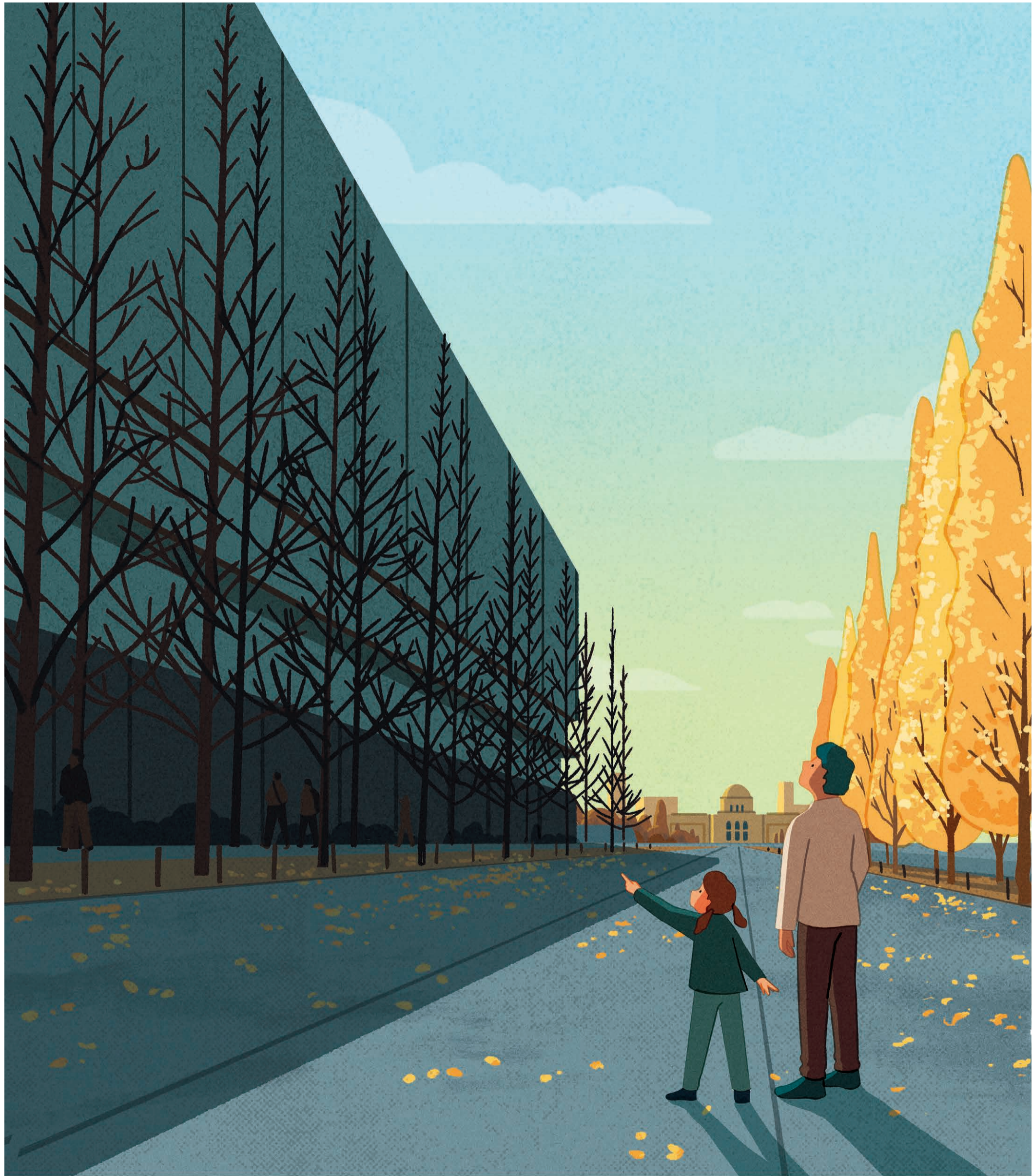
Illustration by Yo HOSONAWADA