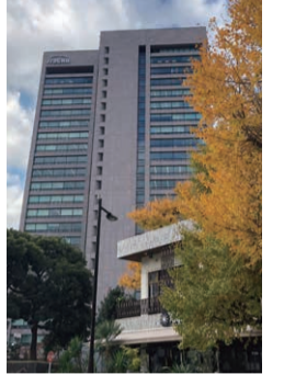
伊藤忠商事ビルは建替えて現在の2倍の高さに。

神 宮外苑は自然的景観の保全を目的とする風致地区として指定され、守られてきた。また、高さ15mを超える建物を建てられないなど開発には規制がかけられていた。だが、東京五輪の国立競技場建設のために都は高さ制限を80mへ規制緩和。容積移転し、190mの超高層ビルの建設を可能にしてしまった。収益重視の事業者の思惑に、国民が献木、育てた歴史的遺産が損なわれようとしている。