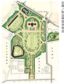
創建当時の神宮外苑

公 園は本来開発はできない。そこで、都は高層ビルを建てるために、「公園まちづくり制度」を使い、神宮外苑の一部を「都市計画公園」の区域からはずしたのだ。公益性の高い公園を再編し、企業、デベロッパー、地権者主導の「まちづくり」の実行へ。長年「都市計画公園」として守られてきたものを切り売りして、ビルを建てるというのは、制度の乱用としかいいようがない。