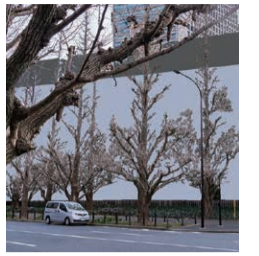
球場のフェンスはほぼイチョウの高さ、並木の間に。地下にのびる根にも影響が。

再 開発では西側イチョウ並木の8mの近距離に、高さ20mの神宮球場が新設され、日差しにきらめく樹々の風景は失われる。地下40mに及ぶ杭の施工は、イチョウの根を傷つけ、水系を断ち、生育の阻害が懸念される。すでに数本のイチョウに枯損が見られ、これ以上の負荷がかかるのを避けなければならない。緊急の対策が求められている。