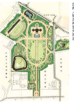
創建当時の神宮外苑

公園は本来開発はできない。そこで、都は高層ビルを建てるために、「公園まちづくり制度」を使い、神宮外苑の一部を「都市計画公園」の区域からはずしたのだ。公益性の高い公園を再編し、企業、デベロッパー、地権者主導の「まちづくり」の実行へ。長年「都市計画公園」として守られてきたものを切り売りして、ビルを建てるというのは、制度の乱用としかいいようがない。