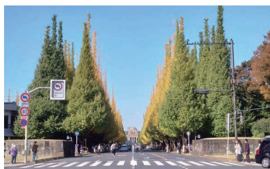
このままでは、左側のイチョウ並木の真裏に球場が建ってしまう。