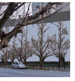
球場のフェンスはほぼイチョウの高さ、並木の間にない。下のびる根にも影響が。

再開発では西側イチョウ並木の8mの近距離に、高さ20mの神宮球場が新設され、日差しにきらめく樹々の風景は失われる。地下40mに及ぶ杭の施工は、イチョウの根を傷つけ、水系を断ち、生育の阻害が懸念される。すでに数本のイチョウに枯損が見られ、これ以上の負荷がかかるのを避けなければならない。緊急の対策が求められている。