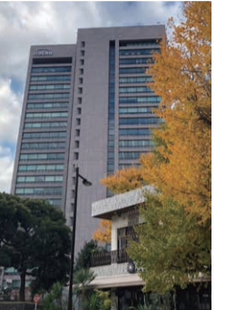
伊藤忠商事ビルは建替えて現在の2倍の高さに。

神宮外苑は自然的景観の保全を目的とする風致地区として指定され、守られてきた。また、高さ15mを超える建物を建てられないなど開発には規制がかけられていた。だが、東京五輪の国立競技場建設のために都は高さ制限を80mへ規制緩和。容積移転し、190mの超高層ビルの建設を可能にしてしまった。収益重視の事業者の思惑に、国民が献木、育てた歴史的な文化遺産が損なわれようとしている。