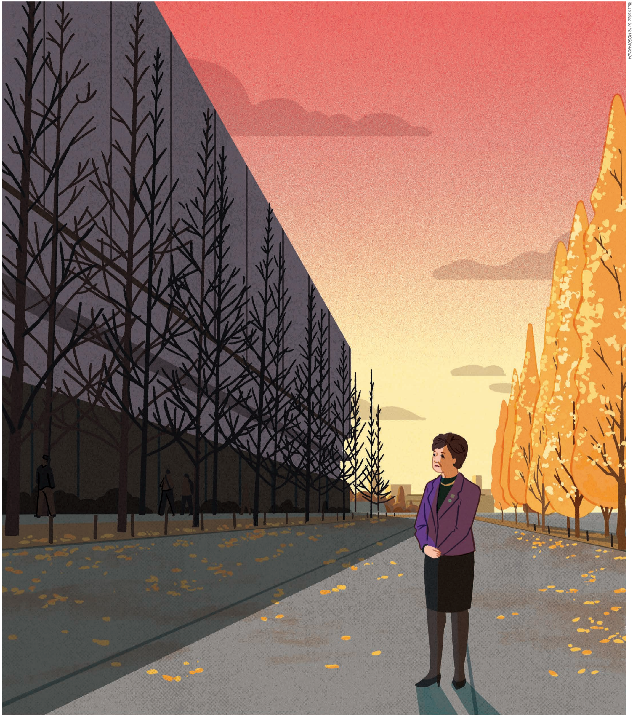
Illustration by Yo HOSONAMADA