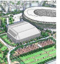
2019年に国立競技場が新設されたのに、なぜ新たなラグビー場が必要なのか。

新ラグビー場建設予定地は建国記念の森。森の3分の2の敷地を要する計画のため、樹々の伐採と建設により森は全滅するといわれている。再開発はスポーツ施設の間いくつかの同じような用途の高層ビルを無理やり詰め込んだ計画。現在のラグビー場は耐震補修・改修工事で十分使用できると多くの専門家が提言している。なぜ歴史ある森を破壊して新設しなくてはならないのか。