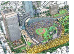
ビル風にさらされる球場で、野球を楽しむことができるのだろうか。

新設される神宮球場は超高層ビルに囲まれた立地。日の当たらない球場には強いビル風が吹きつける。外野スタンドの一部は削られる。6大学野球の聖地として愛され、緑に囲まれ、青空の抜ける神宮球場は完成度の低い計画に侵されようとしている。